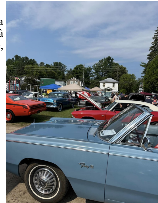
Maxime Proulx-Cadieux Maire de la municipalité de Chénéville